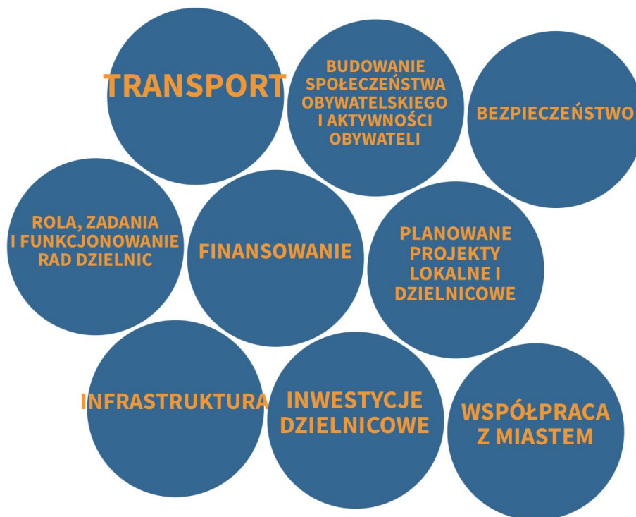
Rysunek 2. Konteksty prezentacji dzielnic w krakowskich wyborach prezydenckich.

złobków, obiektów sportowych); 3) budowania społeczeństwa obywatelskiego i aktywności obywateli; 4) współpracy z miastem (za pośrednictwem rad dzielnic); 5) roli, zadań i funkcjonowania rad dzielnic; 6) bezpieczeństwa (np. osiedli); 7) inwestycji dzielnicowych (np. Centrum Kultury Ruczaj); 8) transportu (np. odkorkowanie miasta, metro); 9) planowanych projektów lokalnych i dzielnicowych (zob. Rysunek 2). W ten sposób omawiane były z jednej strony wyzwania, z jakimi mierzą się mieszkańcy Krakowa, a z drugiej strony perspektywy przyszłego rozwoju dzielnic oraz całego miasta.