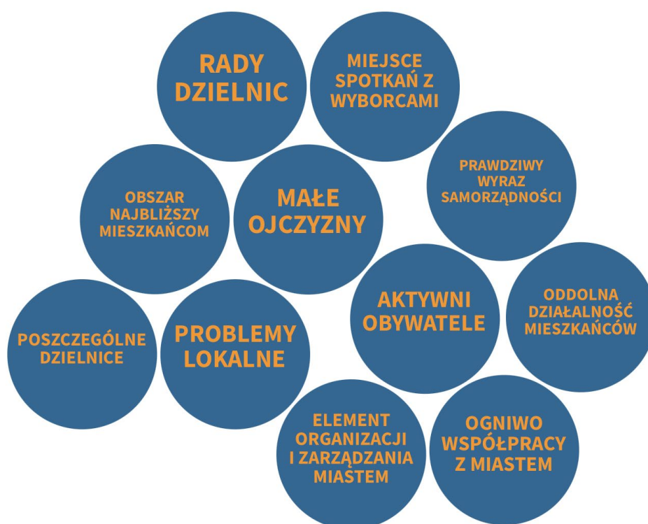
Rysunek 3. Płaszczyzny postrzegania dzielnic w krakowskiej kampanii wyborczej

Przede wszystkim w tym obszarze wybrzmiewała rola rad dzielnic oraz ich współpraca z miastem. Po trzecie, bardzo często odwoływano się do poszczególnych dzielnic, a nie do ogółu. Warto podkreślić, że dzielnicą, o której wspominała w czasie kampanii większość kandydatów jest Nowa Huta – wskazuje to na potencjał rozwojowy tej dzielnicy oraz potrzebę większego włączenia do dyskusji o mieście problemów jej mieszkańców. Po czwarte, dzielnice były tłem spotkań kandydatów z mieszkańcami w charakterystycznych punktach na mapie Krakowa.