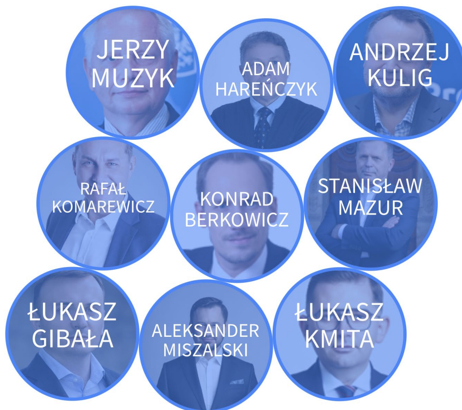
Rysunek 1. Kandydaci w wyborach na Prezydenta Miasta Krakowa w wyborach w 2024 roku.