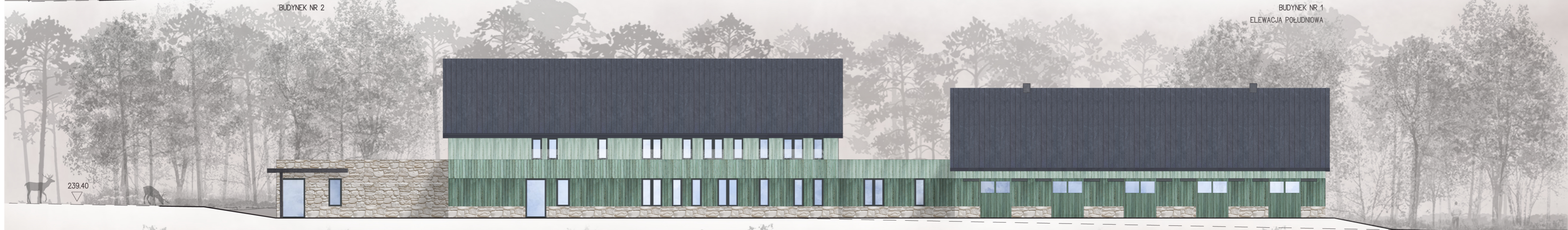
BUDYNEK NR 1