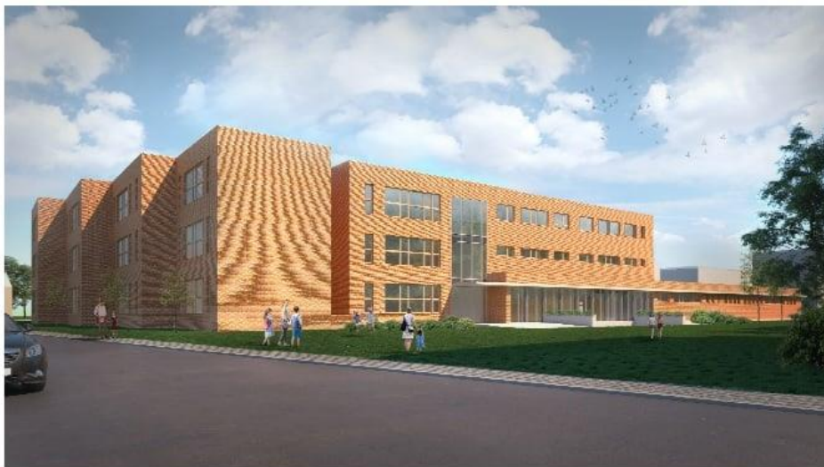
PERSPEKTYWA Z POZIOMU CZŁOWIEKA (widok z kierunku południowo-wschodniego)

PROGRAM FUNKCJONALNO-UŻYTKOWY BUDOWY SZKOŁY PODSTAWOWEJ na działkach o numerach: 219/6, 219/7, 219/8, 219/9 obr. 28 Podgórze przy ul. Grochowej w Krakowie