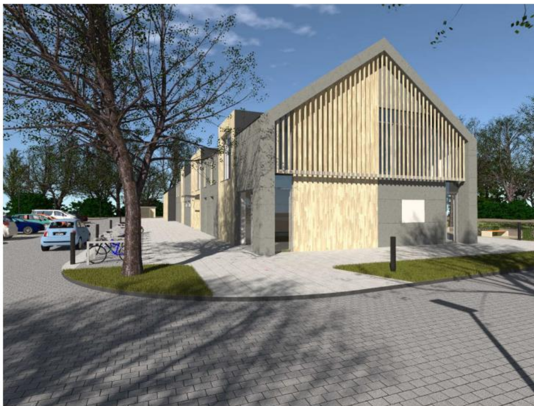
WIDOK OD STRONY WJAZDU NA TEREN DZIAŁKI