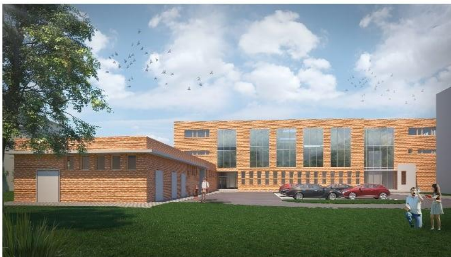
PERSPEKTYWA Z POZIOMU CZŁOWIEKA (widok z kierunku północnego)