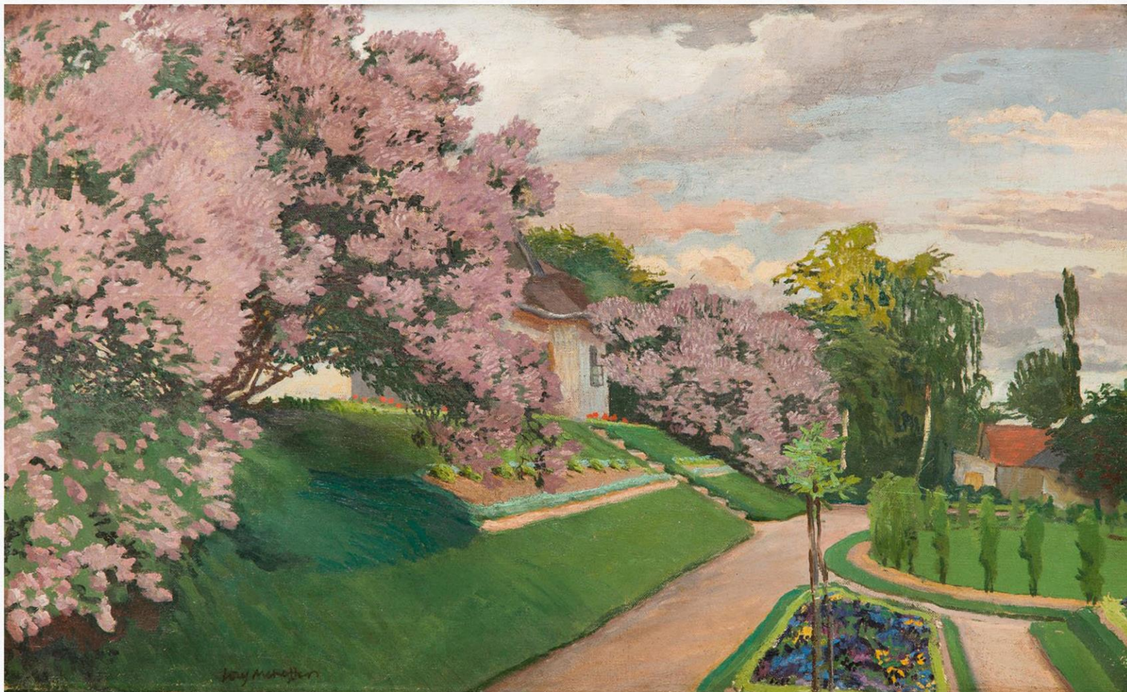
Józef Mehoffer Kwitnące bzy w Jankówce 1907