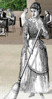
Plac przed pawilonem