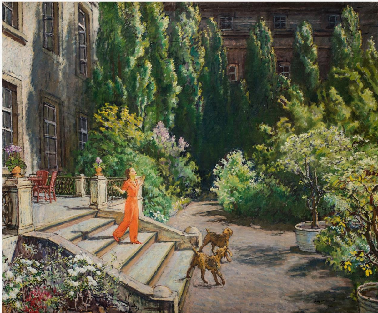
Józef Mehoffer Przed domem przy ul. Krupniczej w Krakowie 1946