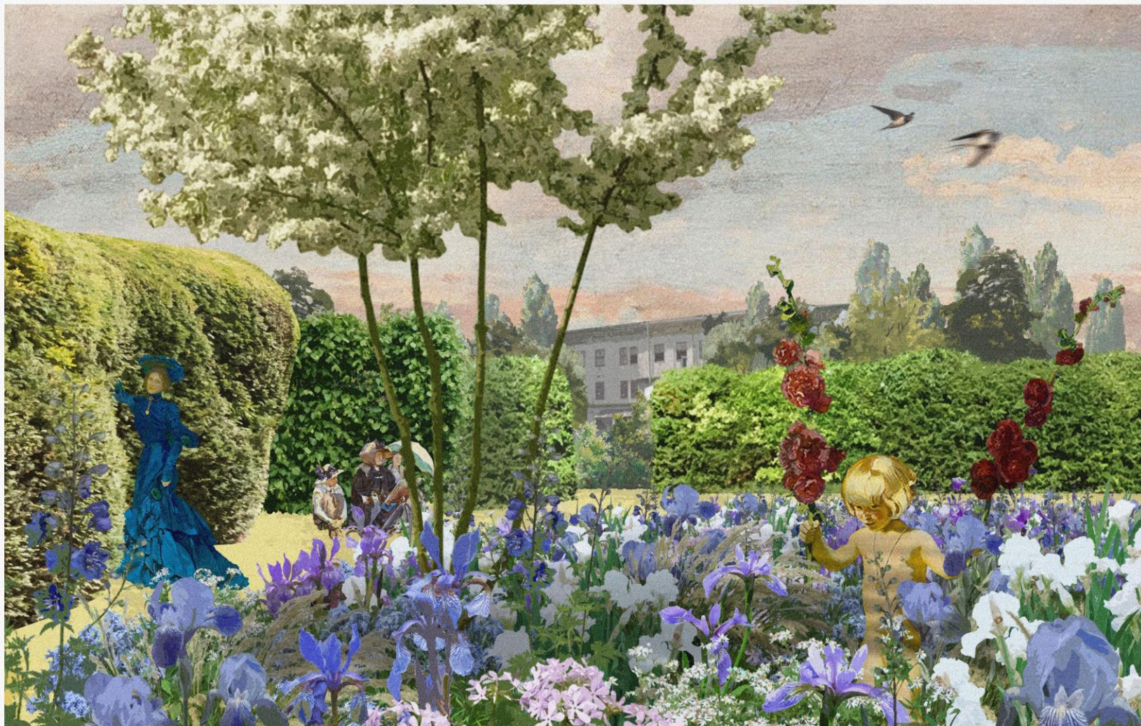
Ogród niebieski irysowy