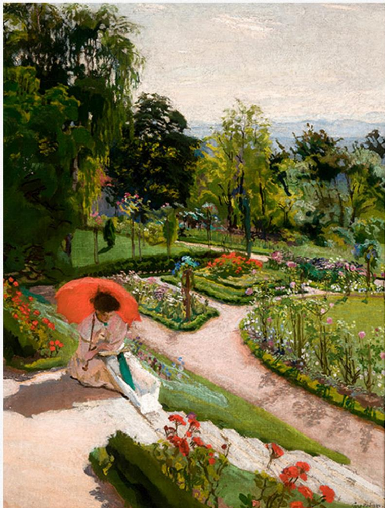
Józef Mehoffer Czerwona parasolka 1917