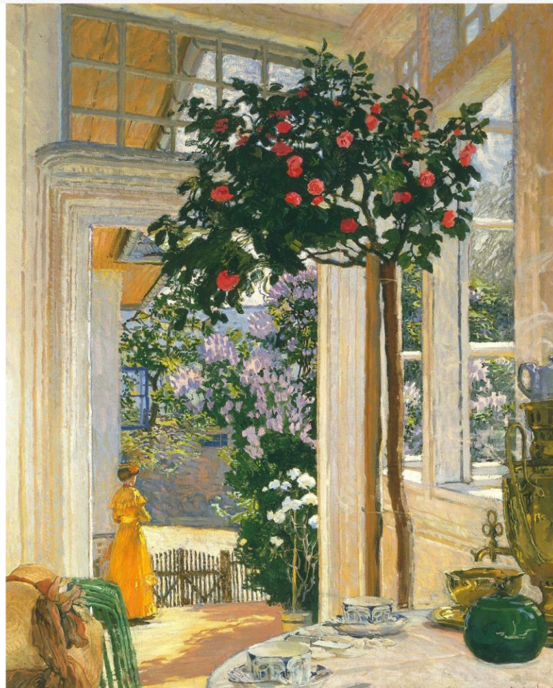
Józef Mehoffer Głonce majowe 1911