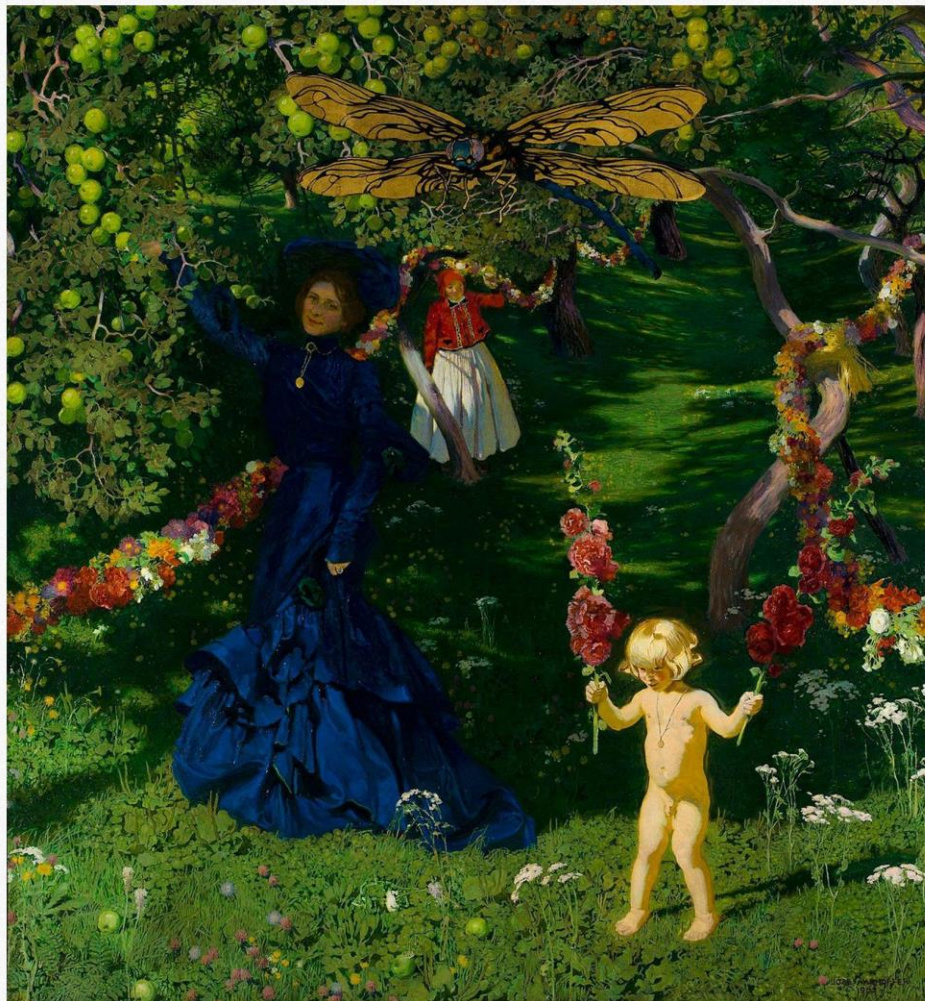
Józef Mehoffer Dziwny ogród 1902