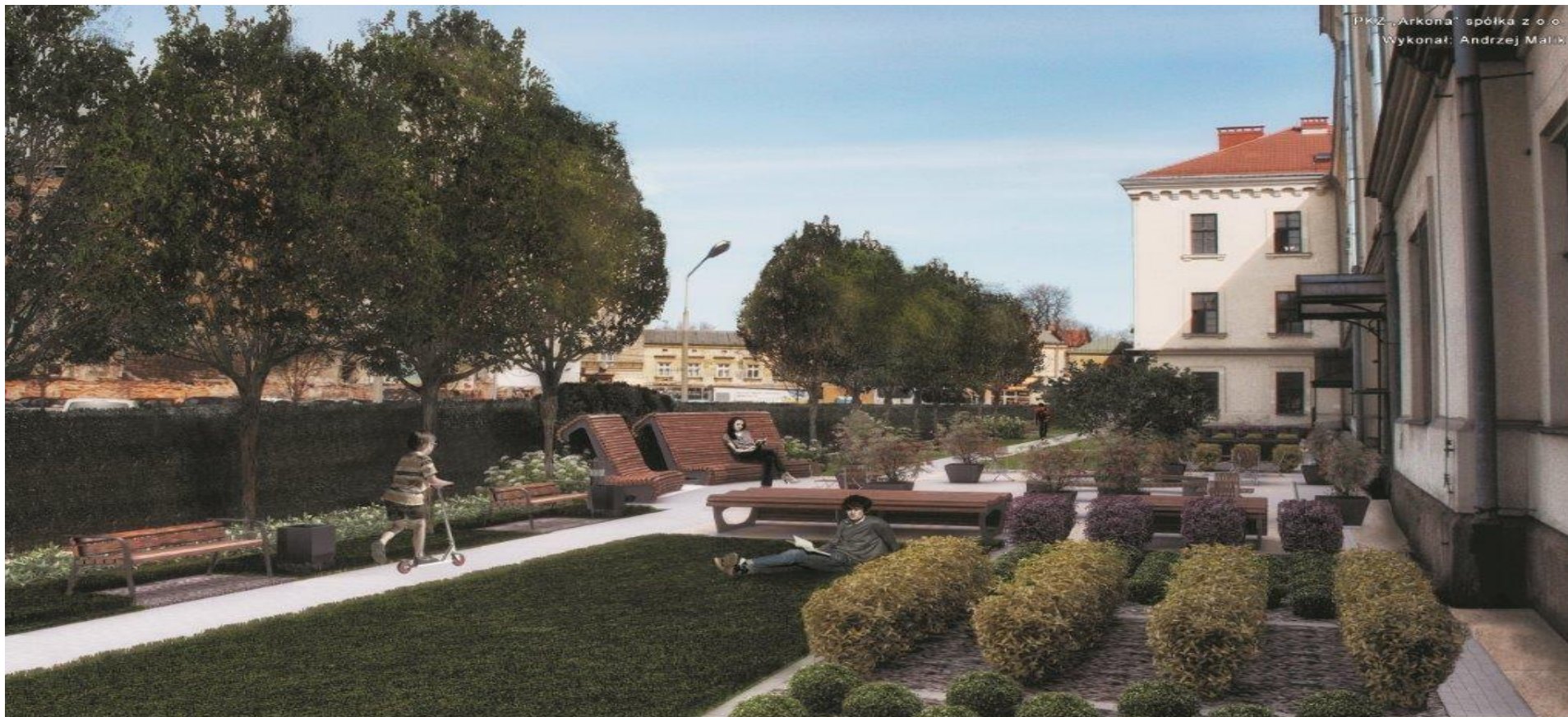
Wojewódzka Biblioteka Publiczna w Krakowie - „Ogród Książki”