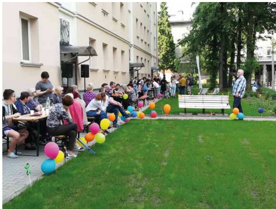
EKOPIKNIK NA ZIELONYM - PIERWSZA INICJATYWA LOKALNA